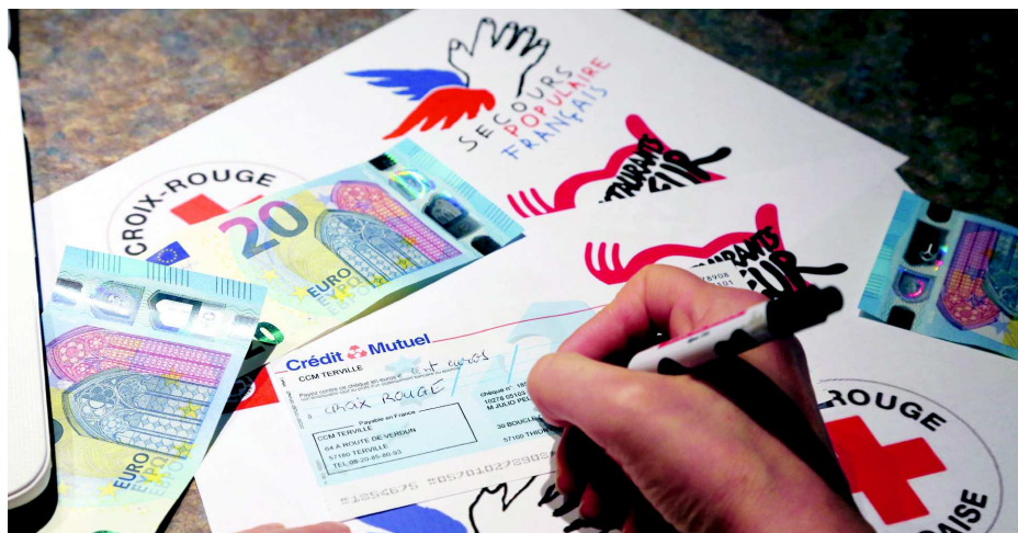
Legs, campagnes d'appel sur le Web... les outils de la philanthropie se sont complexifiés.